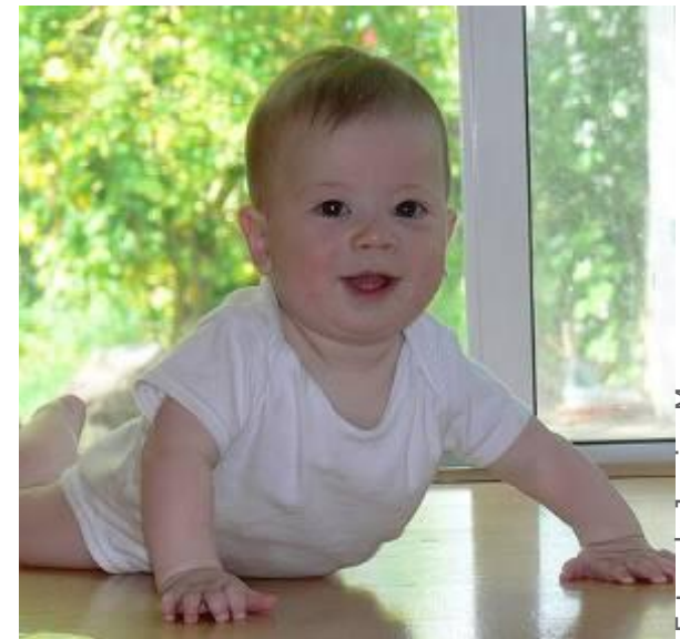
Alegria / Satisfacció